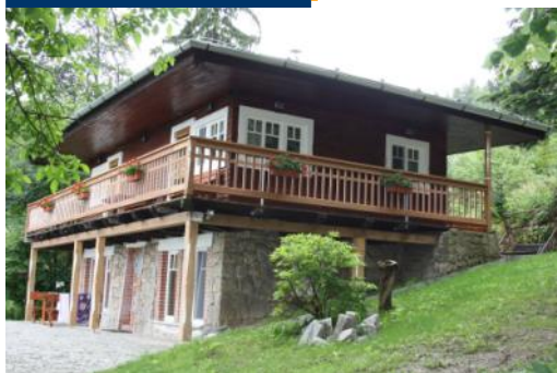
Chata Měsíček na Ostravici

V posledních týdnech byl úspěšně dokončen projekt, který jako jeden